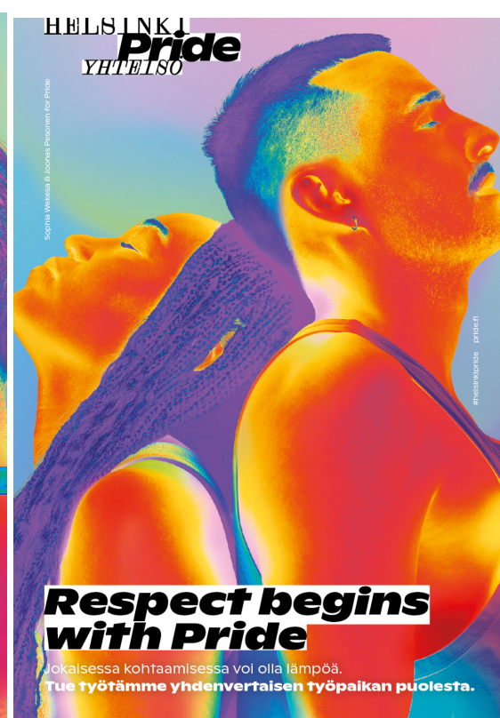
Vaikuttavuuskampanjan kuva-aineistoja 2022.